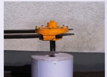
3. Einführen, Selbstzentrierung