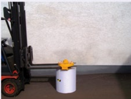
4. Absetzen, automatisches Umschalten auf Greifen